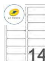
LR7163-100 99,1 x 38,1