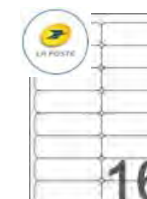
LR7162-100 99,1 x 33,9