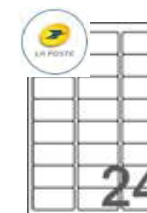
LR7159-100 63,5 x 33,9