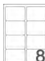
LR7165-100 99,1 x 67,7