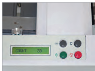
Panneau de commande très simple d'utilisation avec écran LCD.