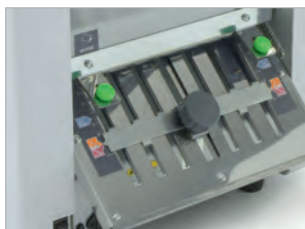
Réglage facile du type pli grâce à des symboles et des codes couleurs.