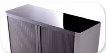
dessus de finition laqué