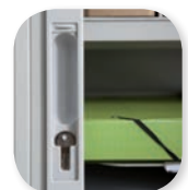
serrure encastrée avec cache de finition