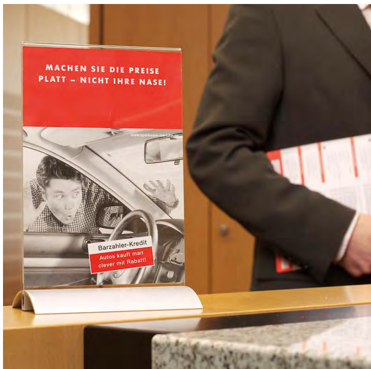
Format A5 Réf. 8588