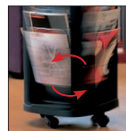
Rotatif à 360°