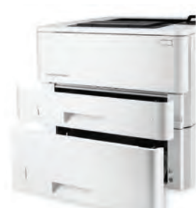
HP LaserJet Pro M402dn avec bac de 550 feuilles en option