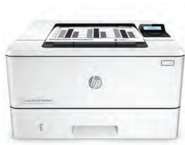
HP LaserJet Pro M402dn

Des performances d'impression et une sécurité renforcée adaptées à votre façon de travailler. Cette imprimante efficace accomplit les tâches plus rapidement et offre une sécurité complète pour une protection optimale contre les menaces. 1 Les toners HP authentiques avec JetIntelligence permettent d'imprimer plus de pages de haute qualité. 2