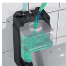
RÉDUCTEUR DE DÉBIT