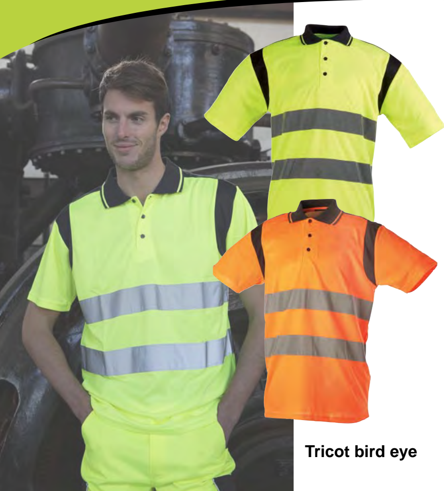
Tricot bird eye