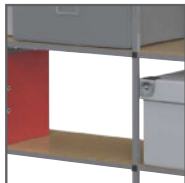
Plateaux Isorel fournis