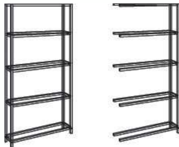
Elément départ + Elément suivant