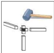
Montage par simple emboîtement